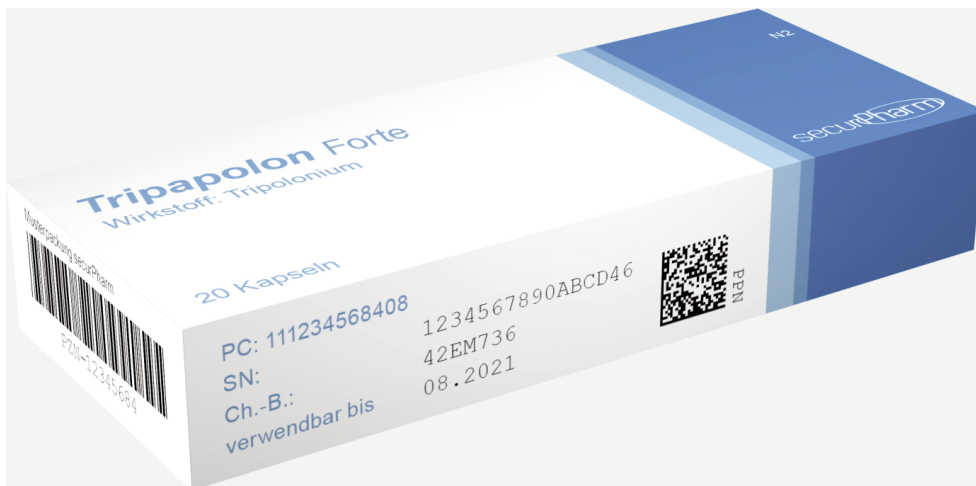
Abbildung 1: Musterpackung eines Arzneimittels mit individuellem Erkennungsmerkmal

Die Seriennummer besteht aus einer maximal 20-stelligen Folge numerischer oder alphanumerischer Zeichen, die zufällig erstellt wird. Als Datenträger für das individuelle Erkennungsmerkmal fungiert ein zweidimensionaler Data Matrix Code, der die maschinelle Lesung (Abscannen) der Daten erlaubt.